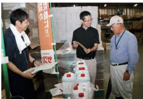
あらゆる場面、難防雑草にザクサ！

訪れた生産者らは、各メーカーから除草剤の特性を聞き、自分の園地に合った除草剤を購入していた。また、除草剤によって噴霧器のノズルを替えることが重要なことから、今回はノズルをサービスしたほか、抽選で生活用品をプレゼントするなどお得な企画が盛りだくさんとなった。