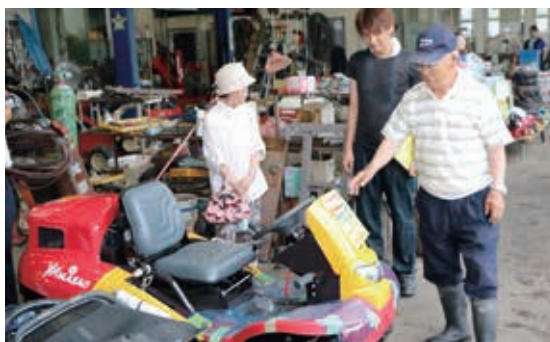
農機センター山内オススメの最新草刈り機