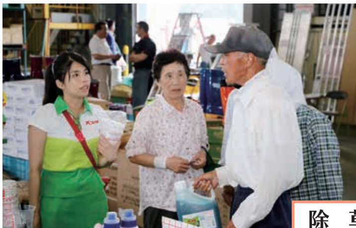
バスタガールが積極的に商品アピール