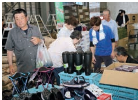
日常に欠かせないアイテムも豊富