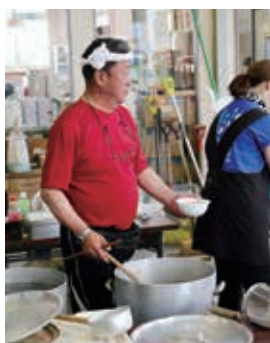
食堂で腕を振るう