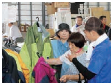
自分好みのカラーをチョイス

ミズノのレインウェアはオシャレなデザイン設計かつ防水性も高いことから人気で、価格も約1万円と魅力的だ。雨が衣服内に侵入するのを防ぐためにファスナー部やポケットには雨返しやフラップが付いているほか、パンツは動きやすさと靴を履いたままでも着脱しやすいようになっている。