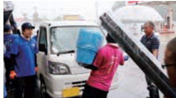
秋本番に向けて準備満タン