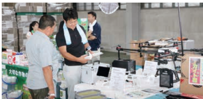
株式会社コハタでは最新鋭ドローンも展示即売