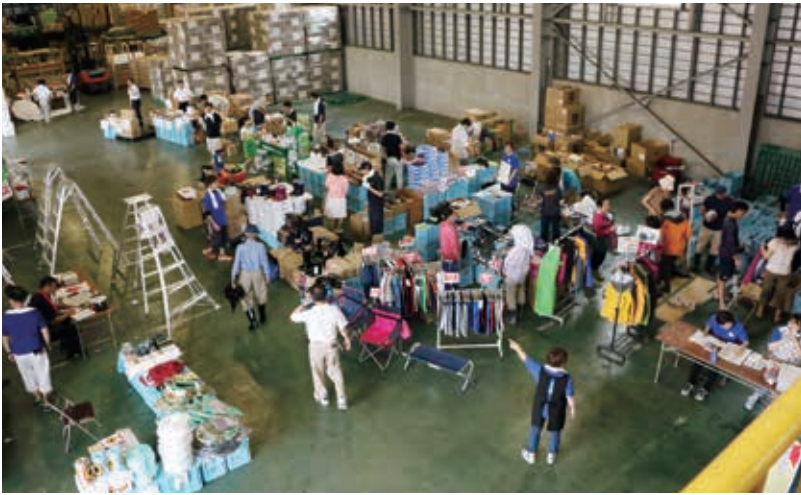
多数のメーカーが出店し、生産資材から生活用品まで色鮮やかに並んだ