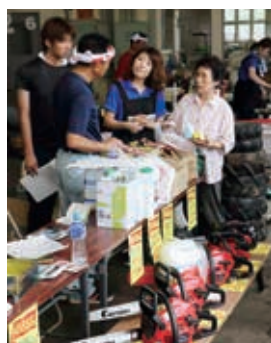
消耗品交換をオススメ