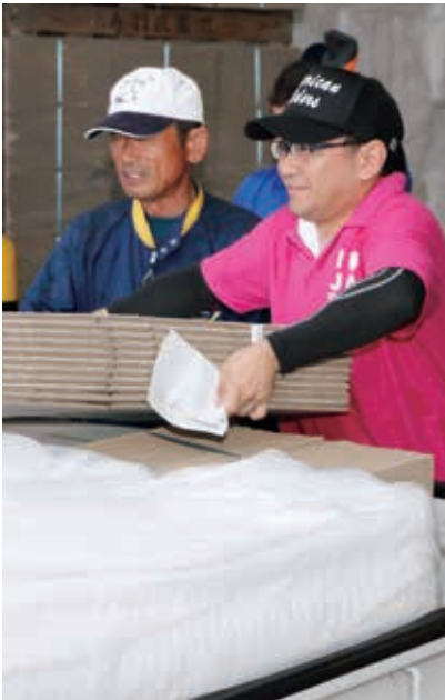
資材担当の職員も大忙し