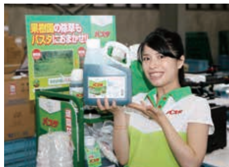
大切な作物のそばにバスタ