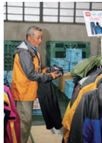
試着でサイズもピッタリ!?