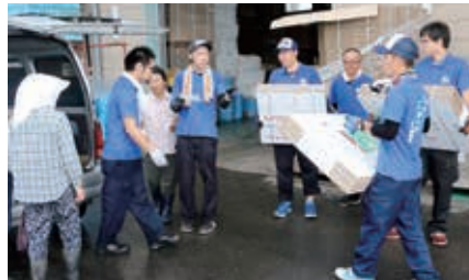
たくさんのお買上げありがとうございます

7月22日、湯口支所で購買の大売り出しが開催され、数多くの生産資材が大特価で販売された。