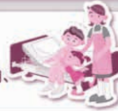
共済掛金例(一部抜粋) (平成27年4月現在)

「介護共済金」はまとまった一時金としてお受取りいただけるので、最も多くの資金が必要となる初期費用はもちろん、毎月の介護費用、収入減少分などに役立てられます。