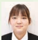
今 梨那 貯金