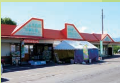
地場農産物の消費拡大で 地元農家を応援！

地場野菜を求めて、連日多くの 人で賑わいを見せる農産物直売所。 農家がつくる野菜や地元で採れた 山菜などが集客率アップと地域活 性化に大きな力を発揮している。 訪れる多くの人は、鮮度や旬と いった直売所ならではの特色ある 品揃えに魅力を感じており、地元 農産物の消費拡大が農業所得増大 に結び付いている。しかし、近年 は出荷者の高齢化や減少に伴い、 直売所への出荷量が減少傾向にあ る。農家はその日の朝に収穫した 鮮度抜群の農産物が店舗一杯に溢 れているという姿が直売所本来の 理想な姿であることから、その対 策は急務とされている。この状況 に対し、いち早く歯止めを掛ける ためにも生産者と直売所を繋ぐ架 け橋として当JAは新たな取組に 踏み切った。