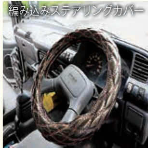
編み込みステアリングカバー