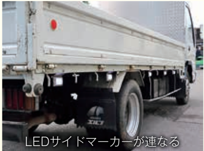
LEDサイドマーカークが連なる