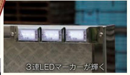
3連LEDマーカークが輝く