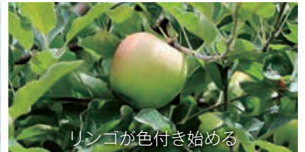
リンゴが色付き始める