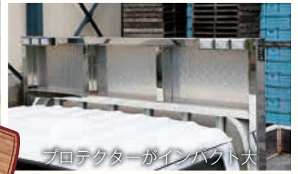
プロテクターがインパクト大