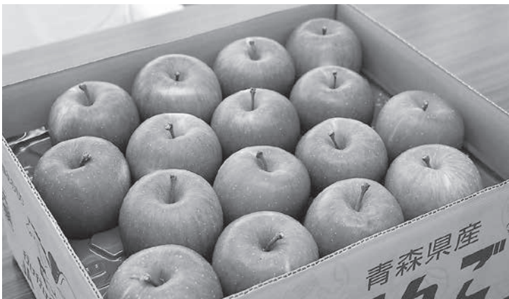
スマートフレッシュにより新鮮なリンゴをお届けできる。

マートフレッシュ効果もあり、ジョナゴールド・サンふじ・王林はほぼ完売状態であり、有袋ふじ、シナゴールドは企画商品の貯蔵以外は残り少ない販売となりました。 平成30年産りんごも当JAをご利用頂き有難うございました。令和元年産りんごも所得向上に努力させていただきまますので、ご利用の程よろしくお願いいたします。