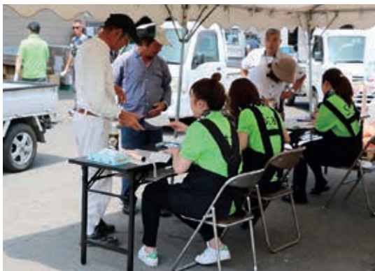
生産者同士相談しながら買い求めていた