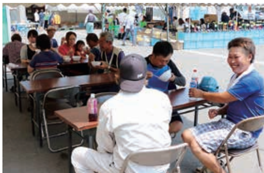
家族や友人とゆっくり休憩