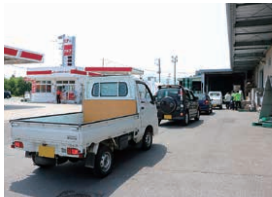
長蛇の列が出来るほどの盛況ぶり