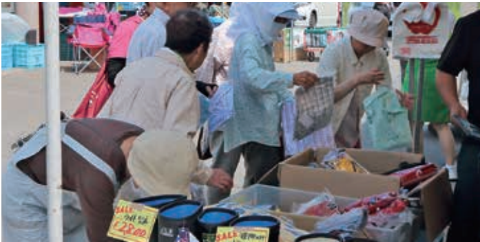
終始盛り上がっていた大特価衣類コーナー