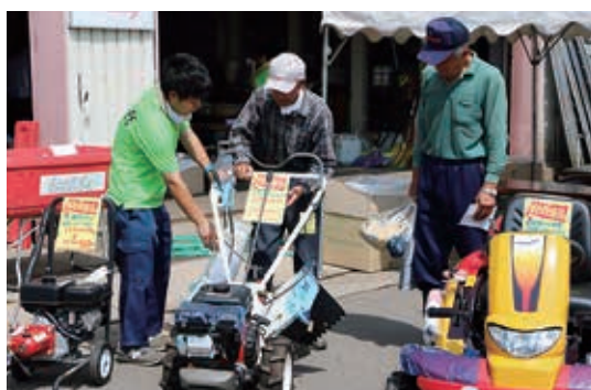
使用中の機械と比較してみる