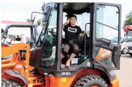
乗るのが大変だったけど楽しい