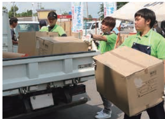
収穫期に備え収穫カゴを大量に購入