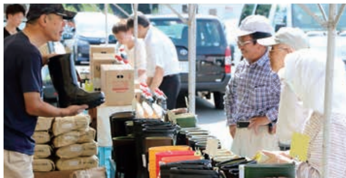
最新の軽量長靴に興味深々