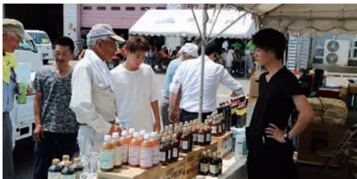
スタミナ源たれは夏の調味料としても大人気