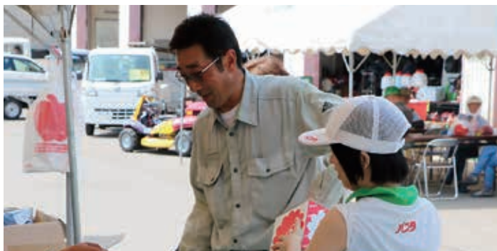
バスタ購入特典でくじ引きが出来る