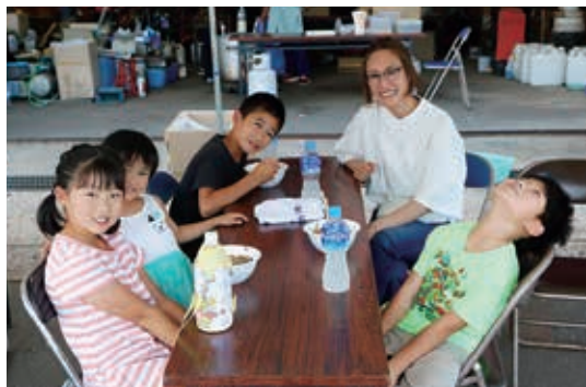
振る舞われたおそばに子どもたちも満足