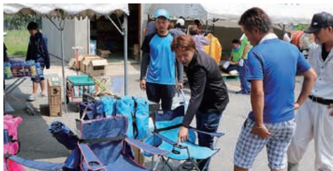
1,000円を切る値段に注目が集まる