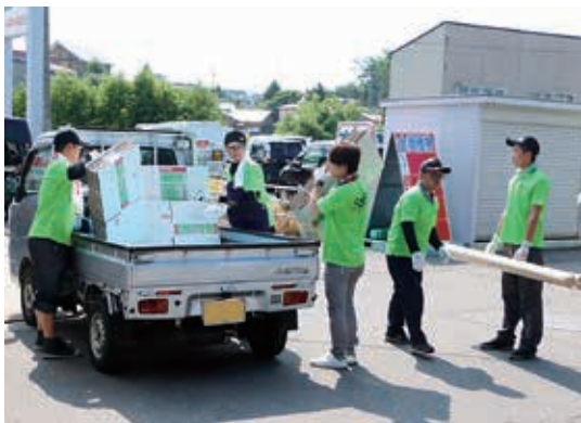
資材の種類ごとに連携を取って素早く対応