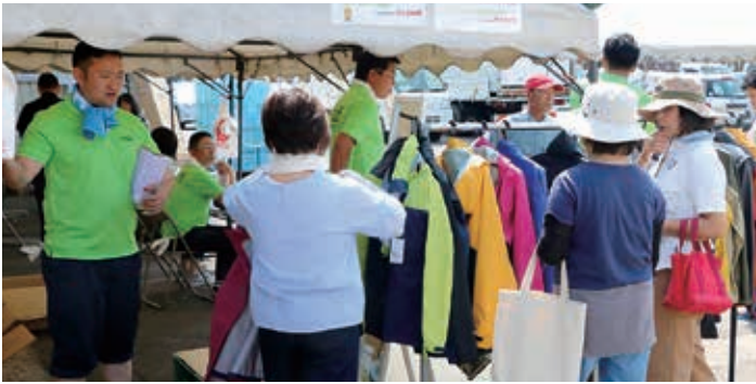
秋に備えてレインスーツを揃える