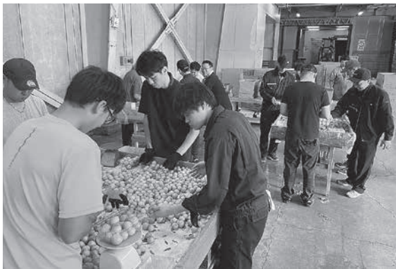
パック詰め作業を一齐に取り掛かる

熟していくスピードが速い為販売課では出荷荷造り作業を素早く行い、「消費者の方にはいい状態で食べてもらいたいため、出荷までの時間をより短く作業していきたい。」と作業員は話していた。