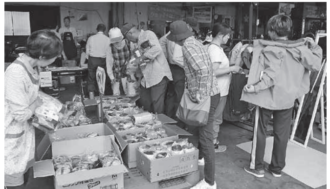
レインウェアブースは終始大盛況