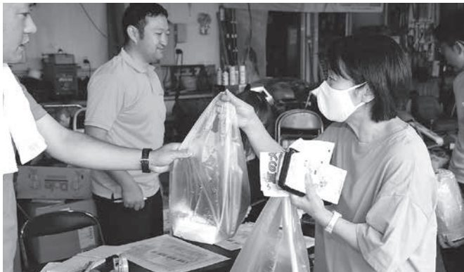
来客者数量限定で粗品も配られた

自粛モードのご時世であるが、このように規模縮小でも開催することによってJAと地域住民との関りが増え、また、来年の開催にも期待して頂けるのではないかと思う。