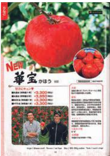
(株)原田種苗のカタログの1ページ