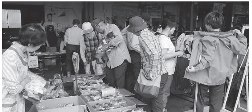
賑わった夏の大売り出し

購買部門では、例年並みの売り上げを残しましたが、スタンドと直売所に関してはコロナ禍もあり売上げを伸ばすことができませんでした。直売所に関しては昨年度に新店舗がオープンしましたが、残念ながら昨年比割れとなりました。大きいイベントや人が多く集まるイベントが組めない事から影響が出ているものも思っています。今後、感染防止対策を踏まえたイベントを考えて行きたいと思っていますので、その際にはよろしく願います。