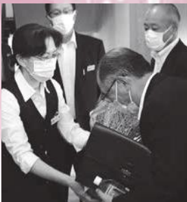
女子職員一同より花束が贈呈された

次年度としましては、先般行われました臨時総会にて承認されたライセンスセンターの建設が進められております。当初の見積もりよりも安くすることが出来ました。全事業費が確定しましたら、何らかの方法で皆様に周知したいと思っておりますので今しばらくお待ち下さい。 今後、りんごの収穫作業等でお忙しいと思いますが、販売課と協力して良い販売が出来るよう尽力して参ります。同時に当JAの利用にも満足して頂けるよう精進して参りますのでよろしく願います。