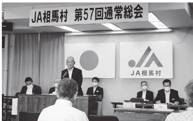
本所にて行われた通常総会

今年度は、長慶閣での開催を予定していたが、新型コロナウイルス感染症拡大防止の観点から公共施設が9月中には使用不可能であることから、書面議決にて行われ、全議案が無事承認された。