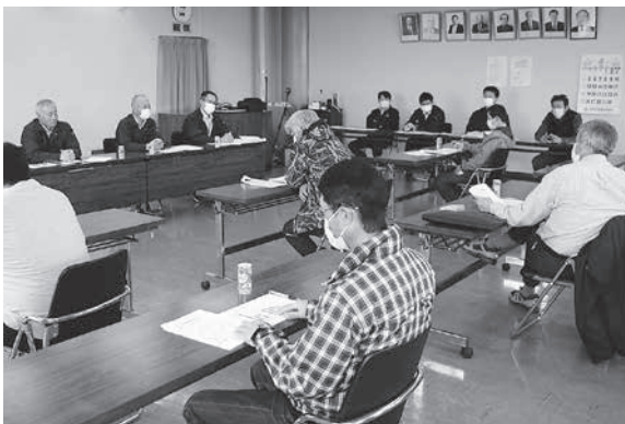
ライセンスセンター新設に係る説明会が行われた。

各事業とも厳しい環境の中でありましたが、当期末処分残余金で2億円程残余があるという事は、組合員の皆様のご協力があった結果であります。この場をお借りして御礼申し上げます。今後出資配当や事業利用配当をお返ししていきたいと思っておりますので、今後とも皆様のご理解とご協力をよろしく願います。