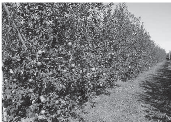
たわわに実った令和2年産りんご

また、ジュース販売の方も好調ではありましたが、原料不足により原料の調達に苦慮しました。