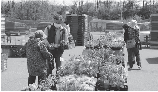
感染対策を講じて開催した花と緑の市

購買部門では、例年並みの売り上げを残しましたが、スタンドと直売所に関してはコロナ禍もあり売上げを伸ばすことができませんでした。直売所に関しては昨年度に新店舗がオープンしましたが、残念ながら昨年比割れとなりました。大きいイベントや人が多く集まるイベントが組めない事から影響が出ているものも思っています。今後、感染防止対策を踏まえたイベントを考えて行きたいと思っていますので、その際にはよろしく願います。