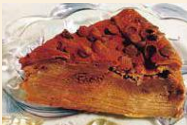
りんごのガトーインビジブル