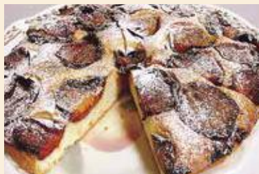
フレッシュブルーンのアーモンドケーキ