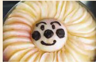
桃コンポートのレアチーズケーキ