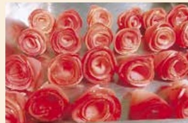
紅玉を使ってバラに♡