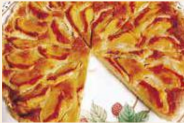
柿のアーモンドタルト