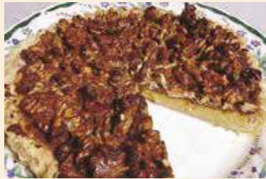
くるみのキャラメルタルト