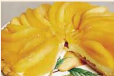
りんごコンポートのレアチーズタルト