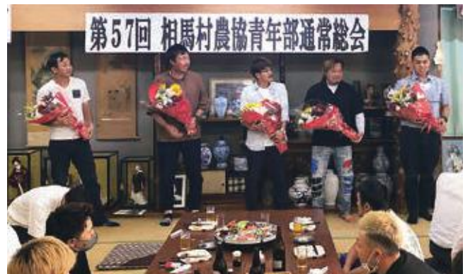
勇退する部員と前事務局への花束贈呈

以前はゴルフ場に勤めていましたが、昨年から本格的に就農しました。りんごの生産技術の相談などを気軽にできる仲間が欲しいと思っていたところ、先輩部員から「青年部に入らないか？」と誘われたのが始まりです。また、友人が入部していたこともきっかけのひとつでした。