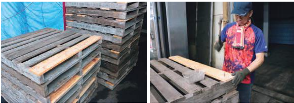
大切なリンゴをしっかりと支えるために修理が進められる木製パレット

リンゴの販売が始まります。他県産の販売状況や市場情勢を見極めながら、企画販売と早期出荷により有利販売に努めます。