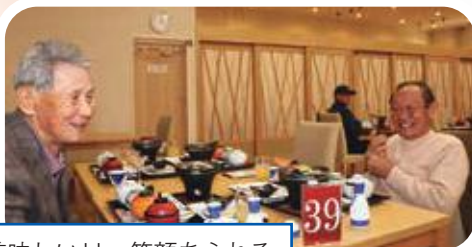
美味しい!! 笑顔あふれる