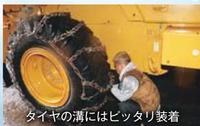
タイヤの溝にはピッタリ装着