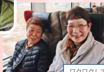
ワクワクしてます