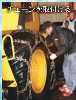
チェーンを取付ける