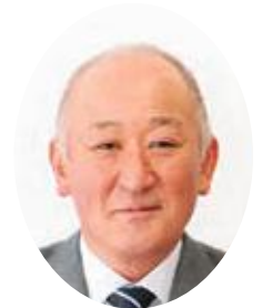
相馬村農業協同組合 代表理事組合長

令和7年産販売につきましては、産地市場で早生種が高値で推移したことから、売価高となり、荷動きが鈍い状態でのスタートとなりました。そのため、中生種への品種間移行が後半へずれ込み、特に黄色品種については厳しい販売となりました。一方、輸出については、「きおう」「トキ」のビターピットが大量発生し、後続する「ぐんま名月」の販売へも影響し、不調な販売となりました。主力である「サンふじ」につきましては、長野県産が高値でスタートしたこと、競合果実のみかん・柿・苺が売り場の中心となり、りんごの売り場は縮小されました。全国的に荷動