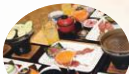
噂のマグロステーキ♪