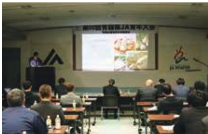
青年部の活動強化と発展を目指す!!

最優秀賞を受賞したテーマが、『地域農業』と『今後の若者農家』について着目した発表で、当農協における課題でもあったと感じました。今回の大会に出席したことで、他農協の取り組みなどを改めて知ることが出来ていい機会となりました。