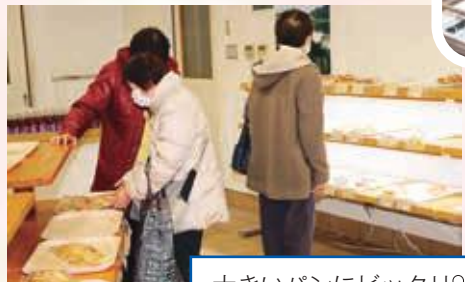
大きいパンにビックリ!!