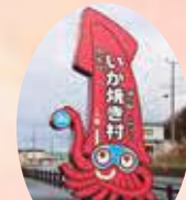
天候が悪くて品揃いが...