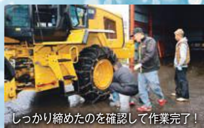
しっかり締めたのを確認して作業完了!