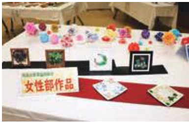
ステキな作品がたくさん並びました!!

ポーセラーツクラフトは、白い磁器に転写紙や絵の具で自由にデザインし、電気炉で焼けるハンドクラフトで、シーグラスアートは、海岸などで拾ったガラス片を素材として制作されるアート作品です。作品展示は、中央公民館相馬館の研修室で行われ、相馬小・中学校の児童の作品や地域の方々が制作した素晴らしい作品と一緒に並べられて注目を集めていました。