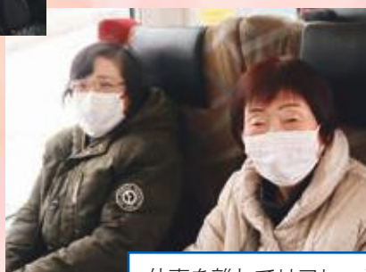
仕事を離れてリフレッシュ