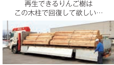
再生できるりんご樹は この木柱で回復して欲しい…