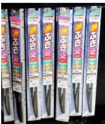
各種サイズ取り揃えております