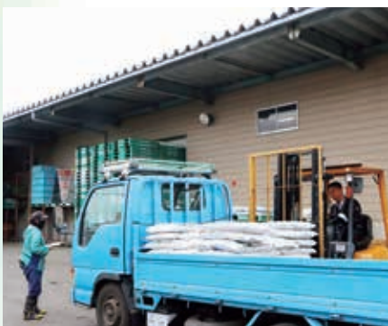
肥料の引取に訪れた会員

3月30日と31日に、飛馬共防会員による肥料の受け取りが湯口支所グリーンプラザ前で行われ、47名の会員が予約した肥料を受け取るために訪れていました。消雪が進んでいる園地が多く、開花前に肥料散布を終わらせようとしている会員もいました。 引取に訪れた会員たちは「今年のはたぐさんの雪が積もったが、雪解けが早い。まだ畑の小屋に行けない場所もあるが、肥料の準備が始まるといよいよ農作業が本格化する気がする」と、これからの農作業に向けての準備を整えています。